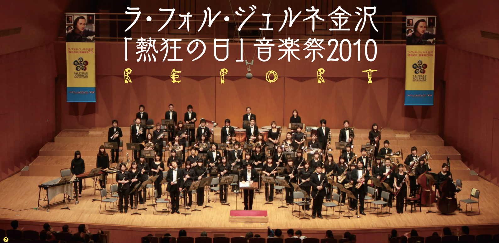
1 6 7 「ラ・フォル・ジュルネ金沢」本公演 / 2 しいのき迎賓館前 / 4 6 金沢駅コンコース / 5 石川県立音楽堂「吹奏楽マスタークラス」