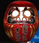
高崎前から取り戻した

主催●ミュージック高崎ジャパン実行委員会 / 高崎市 / (財)高崎市文化スポーツ振興財団